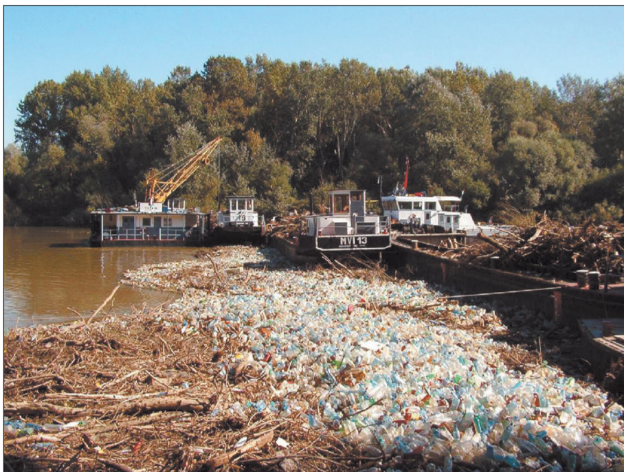
Угорці змушені баржами розчищати українське сміття.

Сусіди намагалися домогтися грошової компенсації від України за жахливе засмічення своєї території — заступник уповноваженого уряду Угорщини на прикордонних водах навіть надсилав Басейновому управлінню